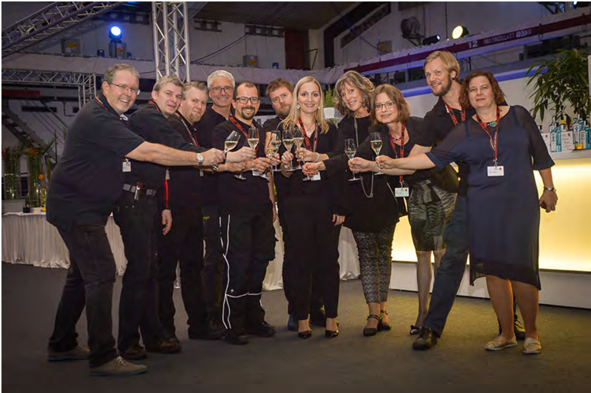
OPUS Team in Feierlaune